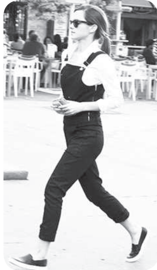
Слипон комбинезонпа та илемлә курәнәт. Сәранран, джинсран ҫәлетни тата ҫурма классикәлли /хура е шура тәсли/ уйрәмах аван.

Апла-тәк ҫак ата-пушмакпа кәмәла кайнә кирек мёнле тумтирпе те пәрлештерме юрать.