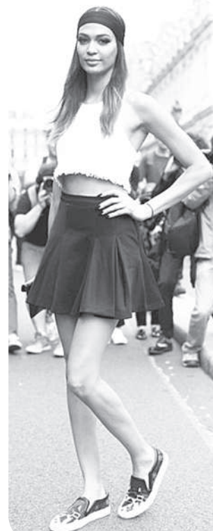
Шәлаварпа ҫеҫ мар, тәрлә юбкапа та килёше тәрәт ку пушмак. Вәл кәске, чәркуҫсирен аяларак, «кәранташ» фасонлә пулма пултарать. ҫавән пекех шорта евәр юбка килёшүллә курәнә.