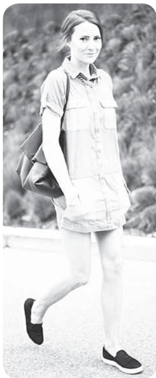
Слипон кәпепе те килёшүллә курәннинчен тәләнмелле-ши? ҫапла, эсә әна ҫак тумтирпе те тәхәнма пултаратән. Чи кирли – кәпен ҫүлти пайә арсын кәпине аса илтертәр. Кәске аркәлли е вәрәмми, ирәкли е пиләк тәлне пәләртаканни – пәтәмпех вырәнлә.