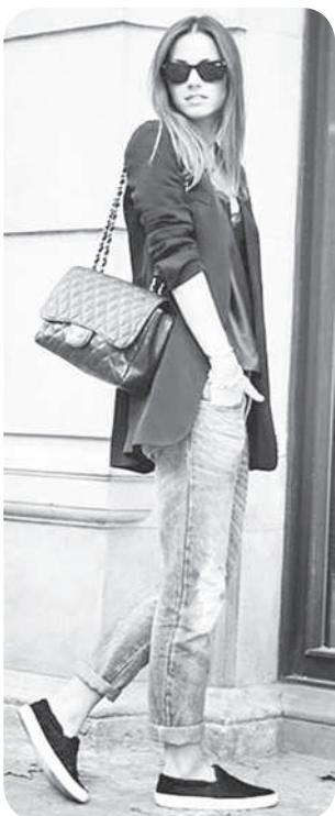
Чи ансам та анлә сарәлнә вариантсенчен пәри – слипона кәскерех ирәк пәҫәллә е скинни джинспа, классикәлла мар шәлаварпа пәрлештересси. Юлашки хура кәвак, шура тата хура тәслә пулсан аван. Шәлавар пәҫәсисене тавәрма та юрать.