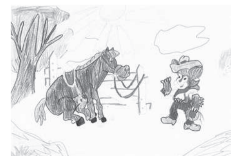
• Дарья НИКОЛЬСКАЯ (Муркаш районĕ, Юнкă школĕ) ўкерчĕкĕ.