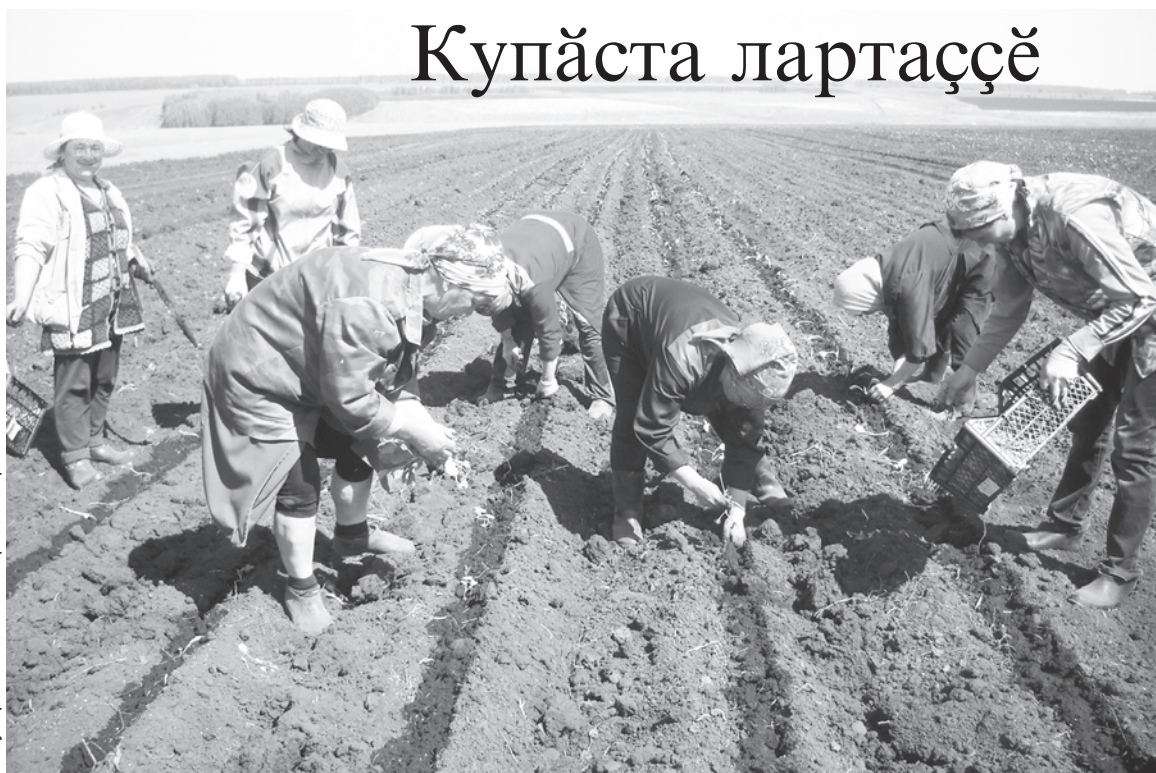
Сануёкрёкёсене www.sar.ru сайтран илнё