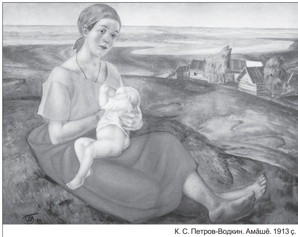
К. С. Петров-Водкин. Амашё. 1913 с.

Шупашкарти тепёр төслөх те чуна сүсентерет. Херарам юлташ хөрне әсатма тухсан пөрле пурәнәкан арсын унә сүлтәләкри хөррачине урама сөклесе тухнә та айәпсәр чуна пусөпе асфальт сине сәпса вәлөрнө.