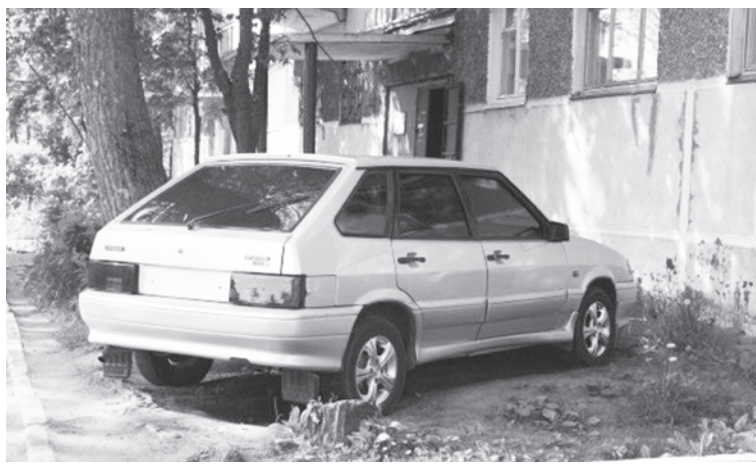
Кӳларӳма Ирина НИКИТИНА хатӳрленӳ.

управлени тӳтӳмӳ сирӳплетнӳ йӳркене пӳсакан граждӳнсене асӳрхаттарасӳсӳ е 1 пинрен пусласа 2 пин тенкӳ таран штрафласӳсӳ. Пуслӳхсемпе ертӳсӳсен 2 пинрен пусласан 5 пин тенкӳ таран кӳларса хума тивет. Предприятисемпе организацисене 5 пинрен пусласа 20 пин тенкӳ таран штраф хурасӳс. Административлӳ йӳркене иккӳмӳш хут пӳссан штраф вици икӳ хута яхӳн е ытларах та пысӳкланатӳ.