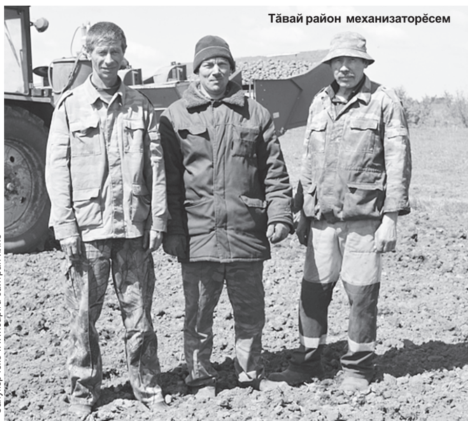
Тәвай район механизаторёсем

Элөк. Ялхушаләх организациёсенче, фермер хушаләхёсенче 6 685 гектар сичне пёрчөллө тата пәрса йышши культурәсем акса хәварнә. Ку паләртнин 100 процентчө пулать.