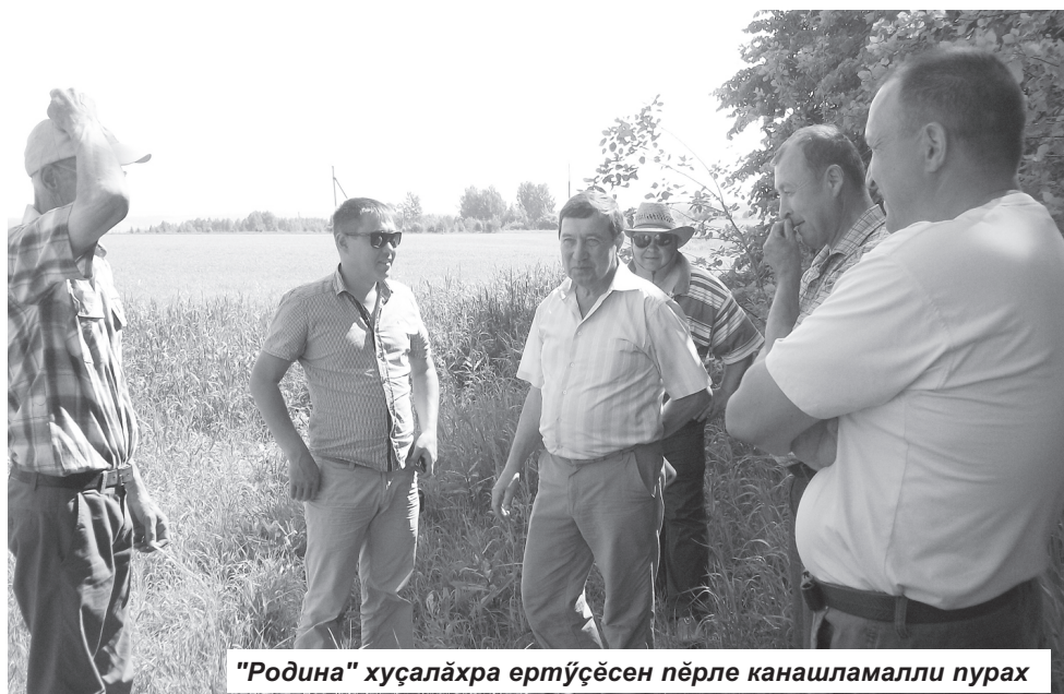
"Родина" хушаләхра ертүсёсен пёрле канашламалли пурах