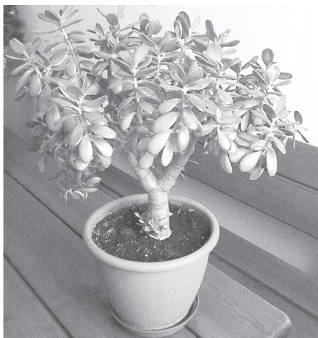
хәйне хальлөн чәмлани усәллә. Ман шутпа сәк сиплө чечек кашни килте пулмалла.

Асәрхаттарни: халәх сөнекен сывату меслечёсемпе усә куриччен тухтәрпа канашласа пәхмалла.