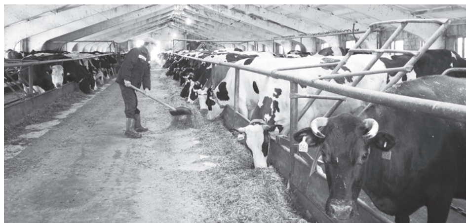
Сәнүкерчөксене www.sar.ru сайтран илнө

Хушаләх ёсне специалистсене явәстарма територинчех икё хутлә сурт сёкпесе лартнә. Сәрә чултан купаланәскере тул ёнчен пурәнмалли сурт-йёр тесе калама та йывәртарах. Строительство ёсёсене вёслеймен-ха, икёмёш хута хәпармалли пусма та тимёртен, вәхәтләхә тунәскер. Сутә, вәрәм коридора вёр сөнө аләксем тухассё. Ертүсё хваттерсене кёрсе курма сөнчө. Пёр тата икё пүлёмлө хваттерсене хәтлә та илемлө, ирёклө, сугә. 2-мёш стр. ➔