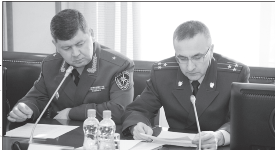
Сәнукерчәкә www.sar.ru сайтран илнә

Раҫсей следстви комитечән управленине коррупцие преступленийәсем синчен 409 хыпар ситнә. Вәсене төпчәсе 315 уголовлә еҫ пусарнә, 60 млн тенкә ытла укса шыраса илмелле тунә (тәпчәв пынә вәхәтра айәплисем 6 млн тенкә тўлесе