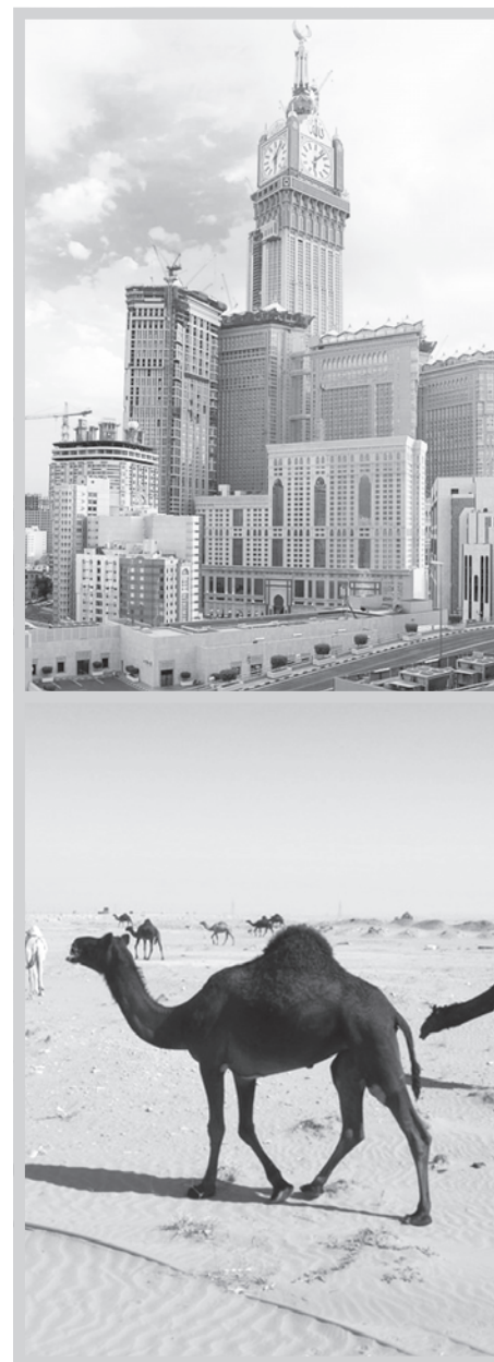
Сӑйерчӑкёсене http://grandstroy.blogspot.ru сайтран илнё

Тулӑ сине хунӑ экспорт налукё (пошлина) 15 процентпа танлашар тата ун сӑмне 7,5 евро хушӑнтар, анчах пёр тонна тырӑшӑн сума 35 евроан пысӑк пулмалла мар. Кӑçалхи февральте йышӑнна сака йёрке июнь уйӑхён вёсёнчен хуçаланё. Правительство сака вӑхӑта тӑсма та пултарё.