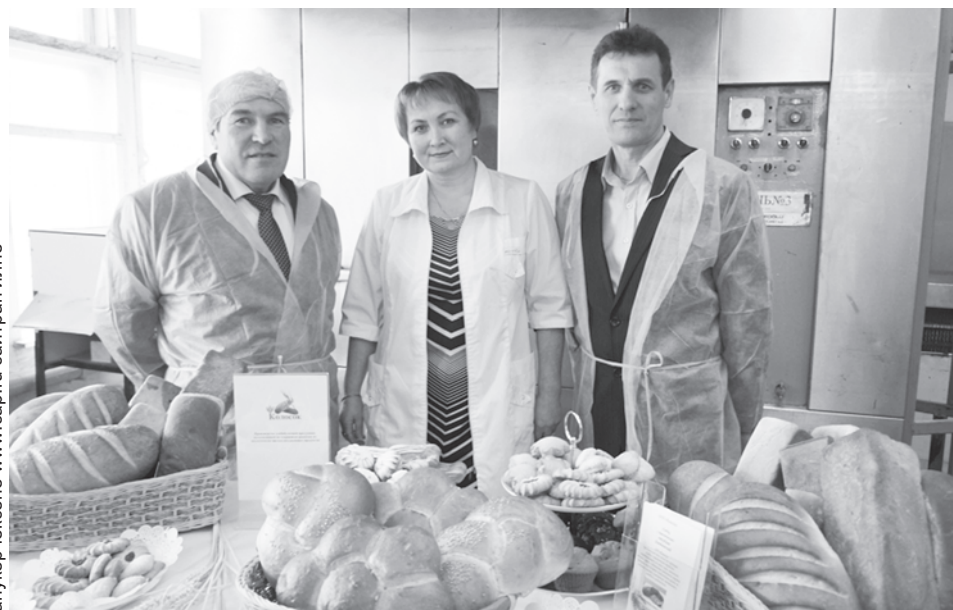
Сәкәрчәкәне www.sar.ru сайтран илнә

Чәрәшкәсинчи пәсернә теңемлә шимёсә сунсәм хавасах туянасә. Лавкәра сүтәнмәсәр тавәрса пани пулман. Кунти тутлә сәкәр-булкәна сүту-иләвә хәпәллә-