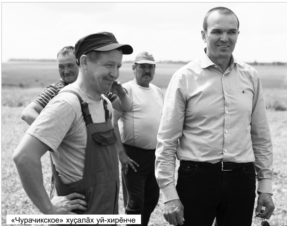
Сәнукерчөке www.sar.ru сайтран илнө

Выльах-чёрлөх йышлә усранә май апатне те самай хатёрлемелле. Кәсәл