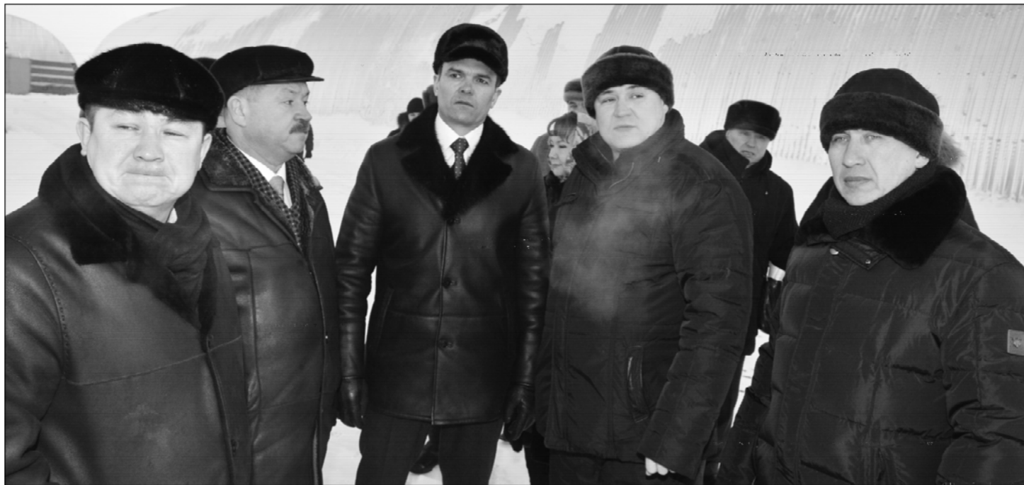
Ёнер республика Пуçлăхĕ Михаил Игнатьев Патăрьел районĕнче пулĕ. Малтанах сĕр улми ситĕнтерессипе паха опыт пухнă "Батыревский" акционерсен хупă обществин ёç-хĕлĕпе паллашрĕ.

Вăл - республикари малта пыракан хуçалăхсенчен пĕри. Унăн производството кăртатăвĕ курăмлă. Иртен сўл çанталăк шăрăх тăчĕ пулин те кашни гектартан тырă - 25,9, сĕр улми 274 центнер пухса кĕртнĕ. Предприятие вăтамран 80 сынна ёç вырăнĕпе тивĕçтерет. Майракаллă шултра вольăх - 600 яхăн, çав шутра сăвакани 280 пус. Иртен сўл кашни ёнерен вăтамран 5406 кг сĕт сунă.