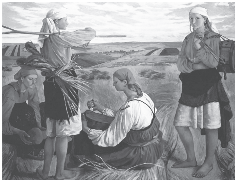
Зинаида Серебрякова. Вырма. 1915 ҫ.