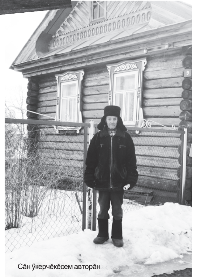
Сăн ўкерчѣкѣсем авторан