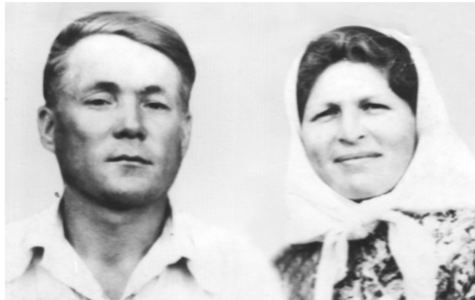
Аттепе анне пирĕн йăх, сĕмĕ историне сырнă. Анне кашни ачине, мăнукне халалласа сăвăсем çырса хăварнă:

Килте Мир фондне укça хывнăшăн Республикăри мире хўтĕлекен комитетăн, чиркĕве пулăшнăшăн Мускав патриархачĕ панă Тав сыравĕсем упранаççĕ.