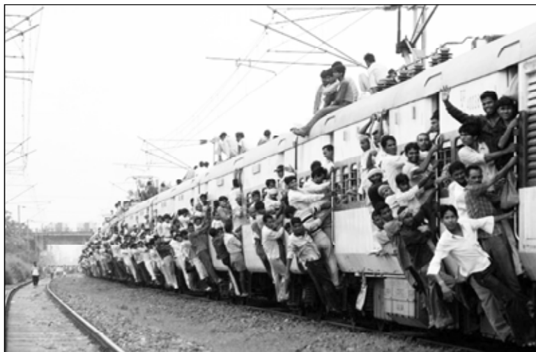
● Хәш-пёр сёр-шывра сәлла та сүресчө. Вөсенчен төслөх илер мар.

Сапах Чаваш Енри Төрлемес станцийёнче «пассажира» кура-кансем пулнә, сакән сынчен Вәрмар станцине пелтернө. Пуй-әс унта ситсен сүл сүрөвсө тытса чарнә. Ун пирки админи-стративлә правәна пәсни тө-лөшпе ёс пусарнә. Адмкодексра