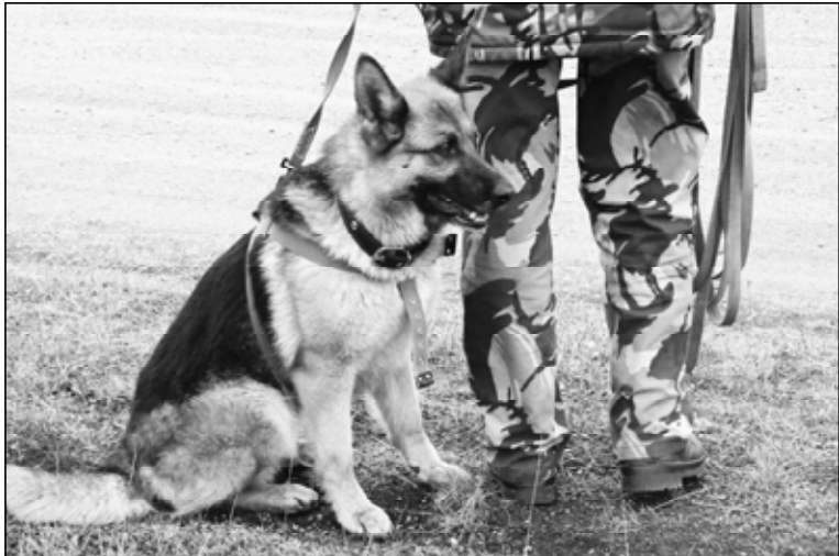
Уголовля айаплава пурнаслакан тытамн кинологи служби 105 сул туларчэ. 1909 сулхи сёртме уйахэн 21-мёшёнче Раçсей шалти ёссен министрэ Петр Столыпин статс-секретарь пусарнипе Санкт-Петербургра полици йттисен пирвайхи питомникне тата дрессировщиксен шкулне уснэ.

Кинологи службин пёлтерёше, сак подразделени ят-сумне сёклес, сирёплённэ йласене малалла аталантарас, сямрэк сотрудниксене суйласа илнэ профессии паранса ёсleme хавхалантарас тёллевпе Раçсей ФСИНён хушавёпе асанна куна УИСан Кинологи службин кунё тесе пёлтернэ.