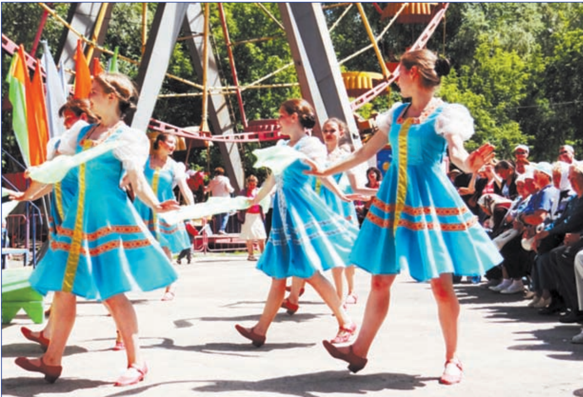
Республика кунĕнче вун виçĕмĕш хут ĕнтĕ Чăваш Енри наци культура пĕрлĕхĕсен пултарула̋х ушкăнĕсен «Тусла̋х кăшăлĕ» фестивалĕ иртрĕ. Яланхилпех ģна тĕп хулари «Шупашкар: 500» культурапа кану паркĕ йышăнчĕ.