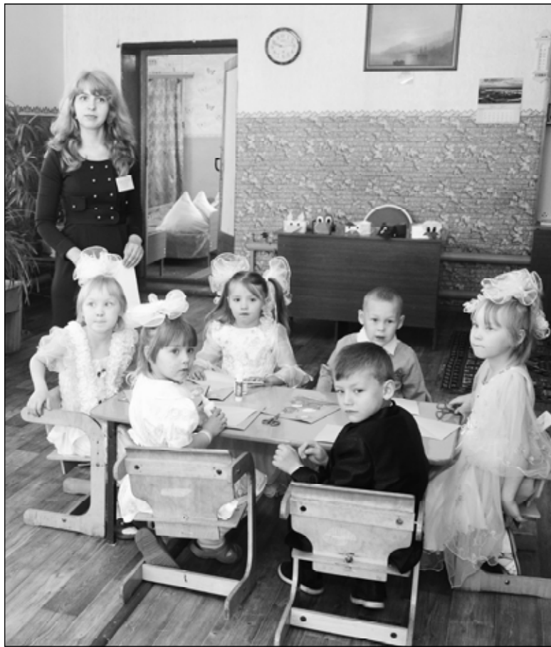
сар.ру сăн укĕрчĕкĕ

Ёслĕ сул çуревĕн тĕп пулăмĕнче – сÿлĕрех асаннă координаци канашĕн ларăвĕнче – ка-