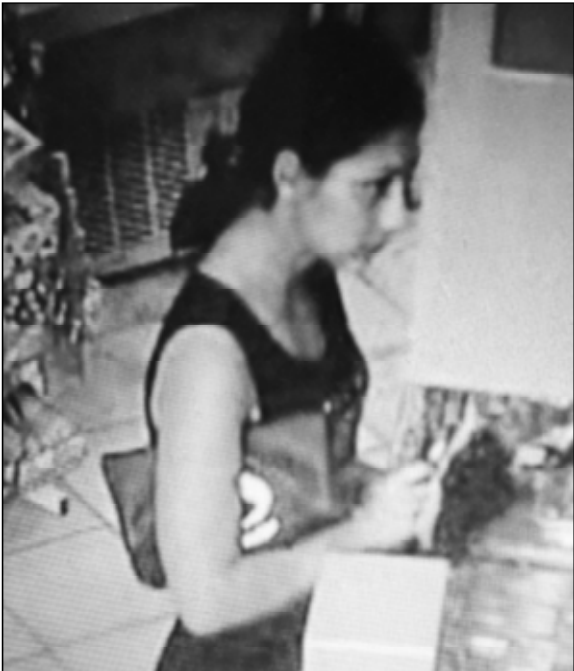
Чөмпөр сынни сакнашкаллишөнех, Шупашкарта туня преступленишөн, маларах та полици аллине сакланнә. Суд умне тәнә, анчах ку уншан урок пулман иккен.

Сёртме уйахөн 24-мөшөнче, Республика кунёнех, Шупашкар заливёничи киоск патне пёр арсын пынә. Вәл сутушәран 5 пин тенкөлөх банкнота вакласа пама ыйтнә. Лешё аңа укча тыттарсан вара арсын шуахашне улаштарнә, вак купюрәсене сутуша каялла таварса панә. Уяв кунёнех заливра халәх йышлә, арсын сакна шута илсе сутушә тимлө пулмасса