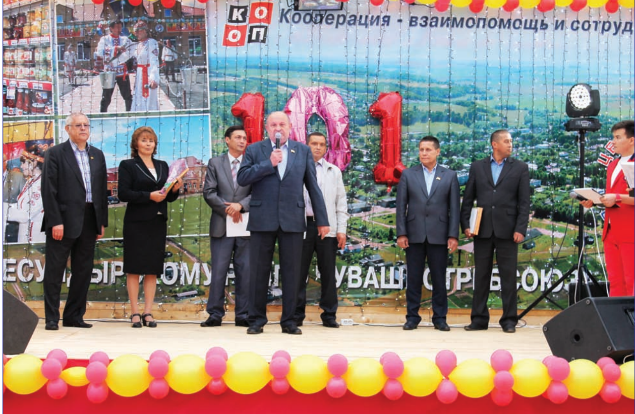
Район 100 сулхи юбилейне пәллә түнә самант.