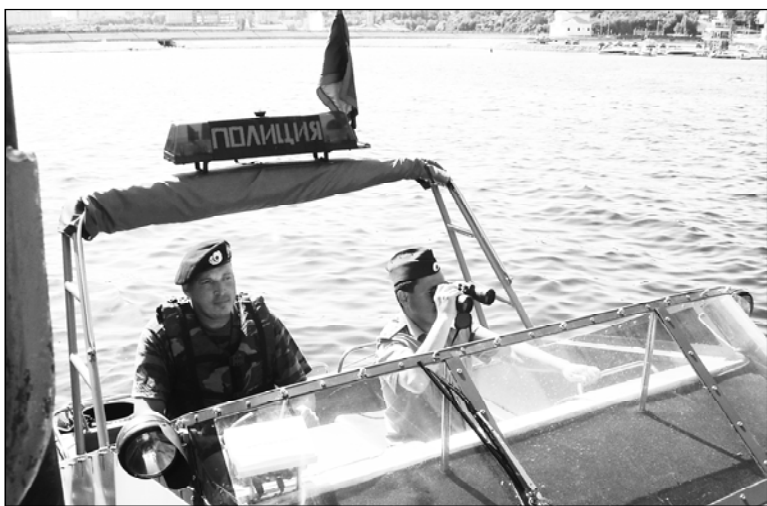
Утә уйахән 25-мөшәнче шыв сиччи полици хайән уявне паллә турё – шыв транспорчә сиччи шалти ёссен органёсене туса хунәранпа 96 сул ситрә.

Төрөссипе, юхан шыв полицийён подразделенийёсене Раҗсейре 1876 султа йөркеленё. Анчах революци хысҗанхи сулсенче юхан шыв транспорчә сиччи шалти ёссен органёсене 1918 сулхи утә уйахән 25-мөшәнче туса хунә тесе йышанна – сав кун Халәх комиссарёсен канаше юхан шыв милицине йөркелесе сиччен калакан декрета алә пусна.