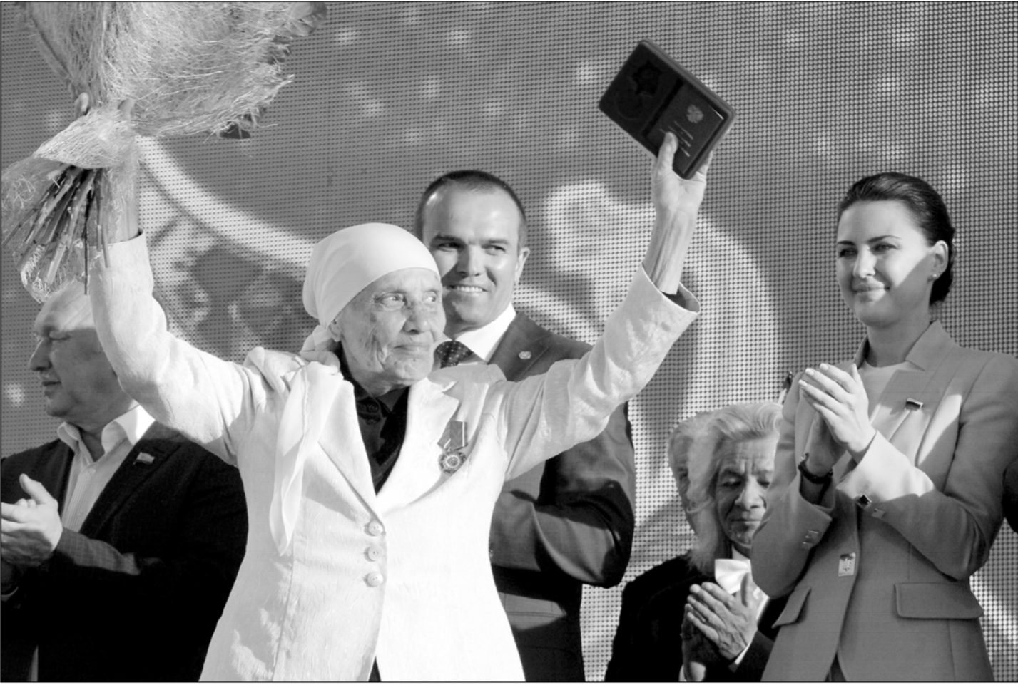
Республика кунĕнче Хĕрлĕ тўрем самантлăха та лăпланмарĕ. Кама кăна йышăнарĕ пур вай: Пĕтĕм чăвашсен икĕмĕш Акатуйне килсе ситнĕ хăнасене, чăваш эстрада юрăсине, Раççей тĕрлĕ регионĕнчи ал ĕç, юрă-ташă астисене, хула сывлăхĕне уява килнĕ енĕшсене... Сакантах Чăваш Ен районĕсемпе хулăсен этнокультура кил-сурчĕсемпе паллашама май килчĕ. Кашниех вай ситнĕ таран тăрăшнă, вай е ку хула хан хай еверлĕхне усса пама мехел ситернĕ.