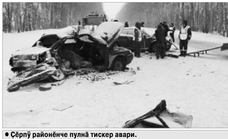
• Ғёрпү районёнче пулнә тискер авари.

Султаләк пуҗланнә-пуҗланман вёсен хисепө темиҗе теҗеткерен те иртрө. Кәрләчән 1-мөшө ситни 20 минут кәна – ҒҒХПИ ёҗченёсем авари пулнә вырәна васканә. Пёрисем – уява җывәх Ғыннисемпе кётсе илнө, теприсем канупа культура учрежденийёсенче пулнә, виҗҗөмөшөсем сөм җёрле пулнине пәхмасәрах сүла тухнә. 22-ри пёр җамрәк М-7 автосупла хәйён «тимёр урхамахе» вёҗтернө. «Лада Гранта» рульне тытса пыраканскер Ғёрпү районёнчи Тупнер сывәхөнче пёр Ғынна таптанә. Ғөнө Шупашкарта пурәннәскер вилмеллех суранланнә. Шел, унән пурнәҗө ытла та ир, 31 сүлтах, татлнә.