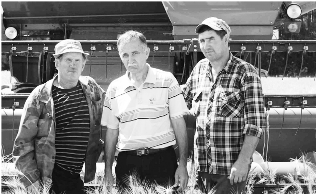
Сăнăвĕрчĕке