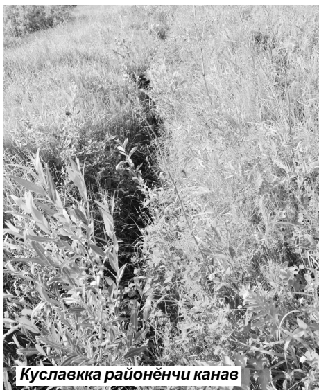
Куславкка районёнчи канава