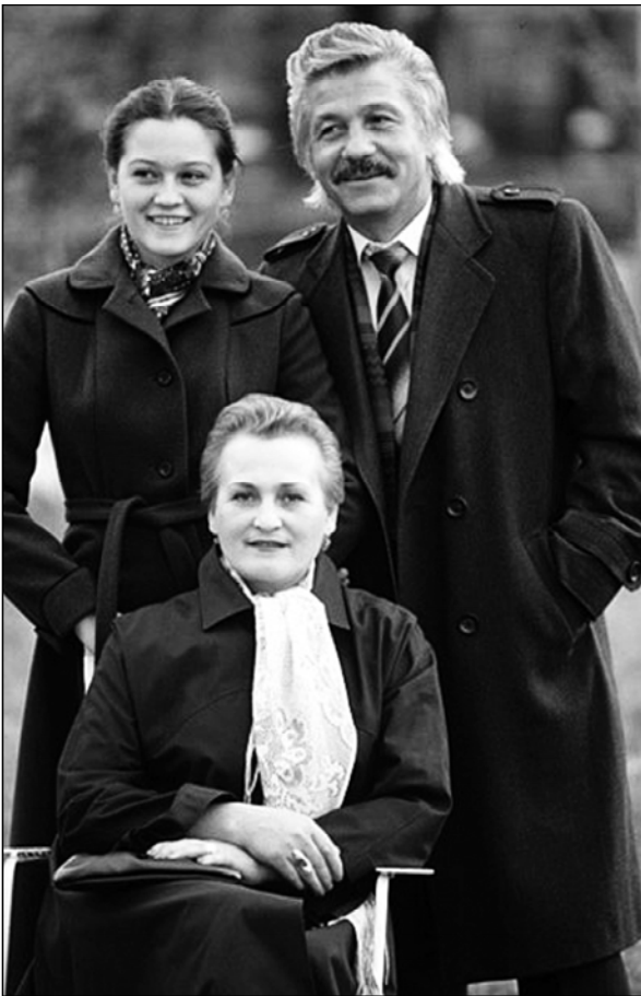
• МĂШĂРĔПЕ ТАТА ХĔРĔПЕ.

Питĕ нумай ĕсре ўкерĕннĕ пулин те Волонтир фильмографийĕнче начар сăнар сук-