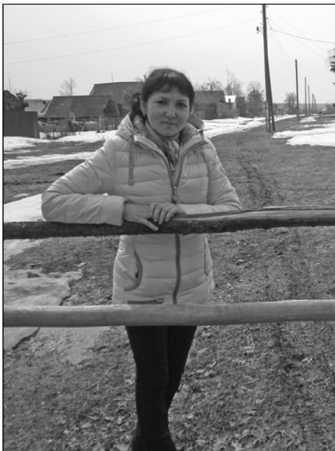
• СИРĔН ЯЛ МĔНЛЕ ПУРĂНАТЬ? СИСТЕРĔР. «ЧХ» КОРРЕСПОНДЕНЧĔ ÇУЛА ТУХМА ЯЛАНАХ ХАТЕР.

хĕпĕртерĕ, хăйне манманшăн, килсе хисеп тунăшăн саванчĕ Пăлаки аппа. Ури ыратнипе, шыçнипе асапланать кинем. Ирtnĕ çул урама та чиперех