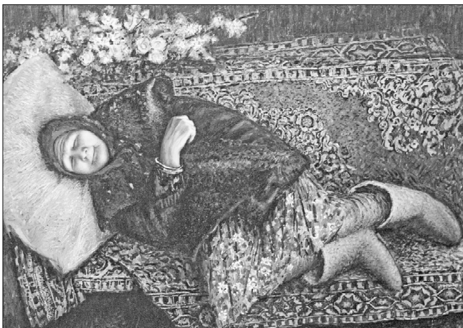
● ӲНЕРÇĔ АМАШĔ КАНАТЬ.

Шкул хыççан Ваçликасси каччи Сĕнтĕрвăрри училищинче сĕтел-пукан тума вĕреннĕ. Темісе султан тин çамрăкăн ёмĕчĕ пурнăçланнă: Шупашкарти ӳнер училищин студентĕ пулса тăнă вăл. Кайран çĕршыври чи сумлă аслă шкулта – Ленинградри СССР ӳнер академийĕн И.Е.Репин ячĕллĕ живопис, скульптура тата архитектура институтĕнче – асталăхне туптанă. Унтан Герцен ячĕллĕ педагогика институтĕнче ӳнерпе графи-