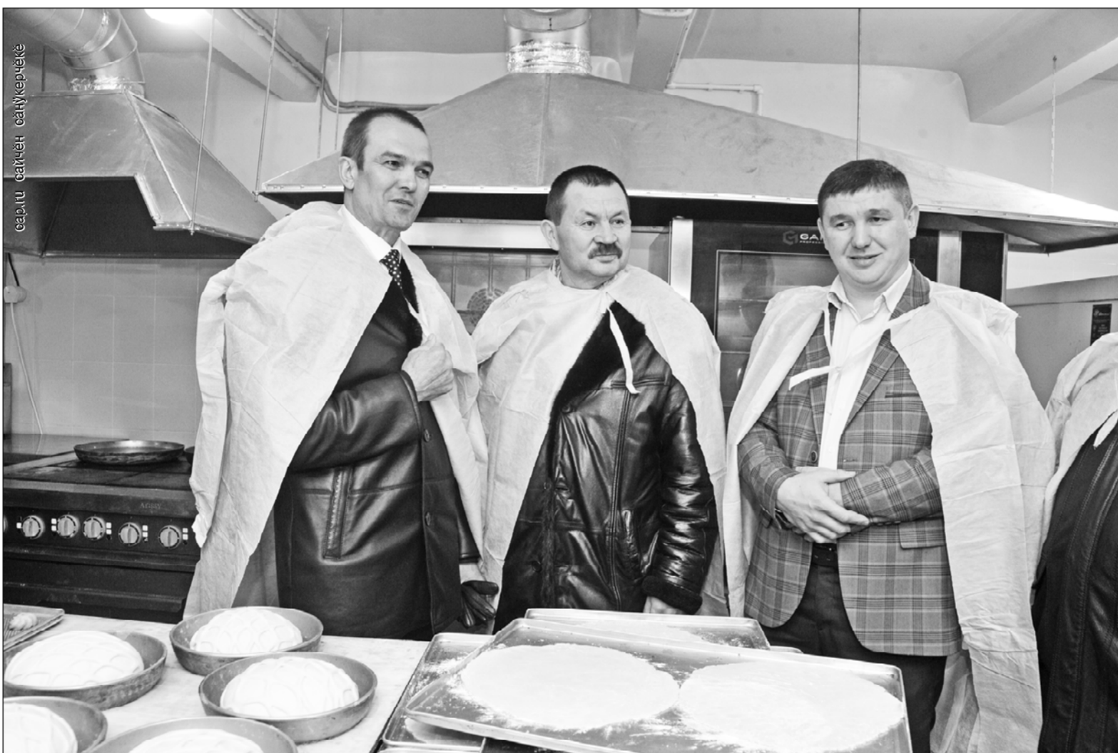
«Сутугәсен патшаләхө», «Иккөмөш Рублевка» – мөйлө кәна хак пәмарөс Пәтәрөл районө Шәнкәртәма! Сәкәнтә пөррөмөш хут пулнә сын хөхөм сүртсөнчө курсә төлөнөт.