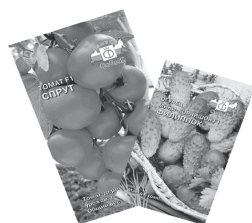
УЙӘХПА ХЁВЕЛ КАЛЕНДАРЁПЕ УСӘ КУРНӘ ЧУХ САКСЕНЕ ШУТА ИЛМЕЛЛЕ:

Февралён 19-20-мёшёсенче Шупашкарта «Николаевский» суту-илү комплексёнче «Сёрлуми – 2015» курав иретет. Уявра сёрлумин тёрлө сорчөпе палашма, туянма май пулө. Шупашкар хула администрацийё пенсионерсене туянна сёрлумине кил умнех ситерсе пама шантарать.