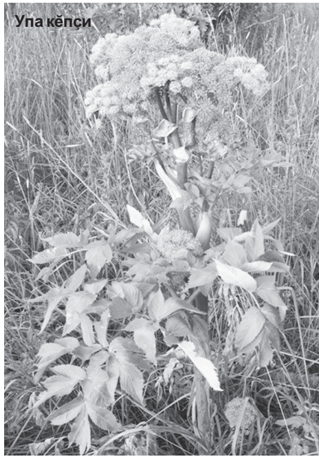
Упа кәпҗи Асәрхаттарни: халәх сәнекен сывату меслечәсемпе усә куриччен тухтәрла канашласа пәхмалла.

Ура чәрнинчи кәмпа чирәнчен. Ыхрана теркәласа ура чәрни җине хумалла, бинтпа җирәплетсе резина пурнеске тәхәнтартмалла. Ирпе аңа салтмалла. җакна эрнере 3 хут тумалла – мән сывалса җитичен.