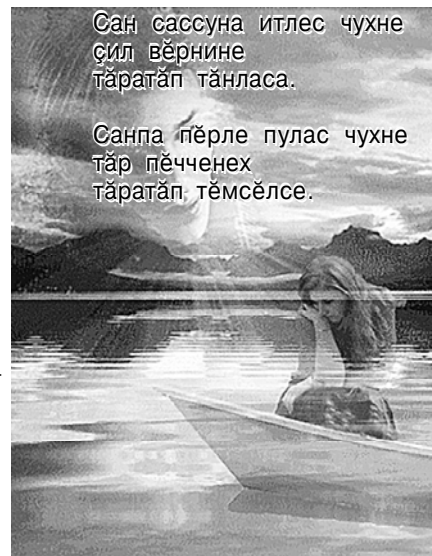
Сан сассуна итлес чухне ҫил вӱрнине тӱратӱп тӱнласа.

тӱратӱп умӱнта — ыйткалакан пек. *** Сан куҫунтан пӱхас чухне ҫӱлтӱр ҫине тӱратӱп тинкерсе.