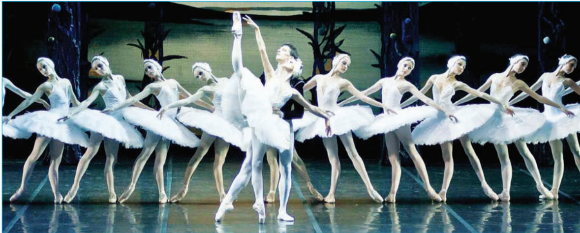
Пётм тёнчери "Раһсей – спорт сёр-шывё" форум йёркелүсисем унта хутшанакансен канавё пирки те манман. Чаваш Ен төп хулинче вёсем валли анла культура программы хатёрленё.

Форум иртно кунсенче Нацы музейенче, Хальхи вадхатри искусстван центрёненче, Чаваш патшалых филармонийенче, Чаваш патшалых операпа балет театренче, Сар мухтавён музейенче культура мероприятийёсем хатёрленё.