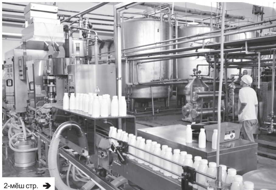
2-мёш стр. →

Паллах, И.Н. Ульянов ячёллё Чăваш патшалăх университетён экономика факультетёнче "Организацисен менеджменчё" специальнос алла илнё, каярах сунтармалли-сёрмелли материалсен бизнесёнче тăрмашнă сўлсем – шухăш-кăмал сирёплённё тапхăр.