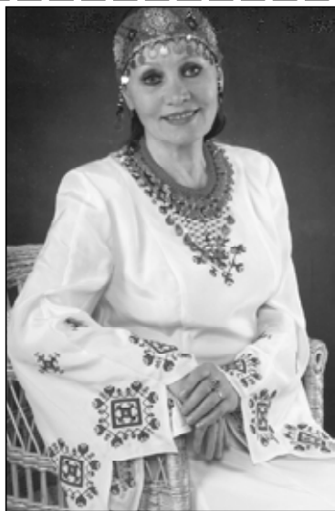
ситереймен. Унан икселми пултарулахĕ тавра нумай каласрĕс уяв каçенче. Чăваш патшалăх сăмрăксен театрĕнче малашне те сĕнĕ рольсем калăплĕ вăл.