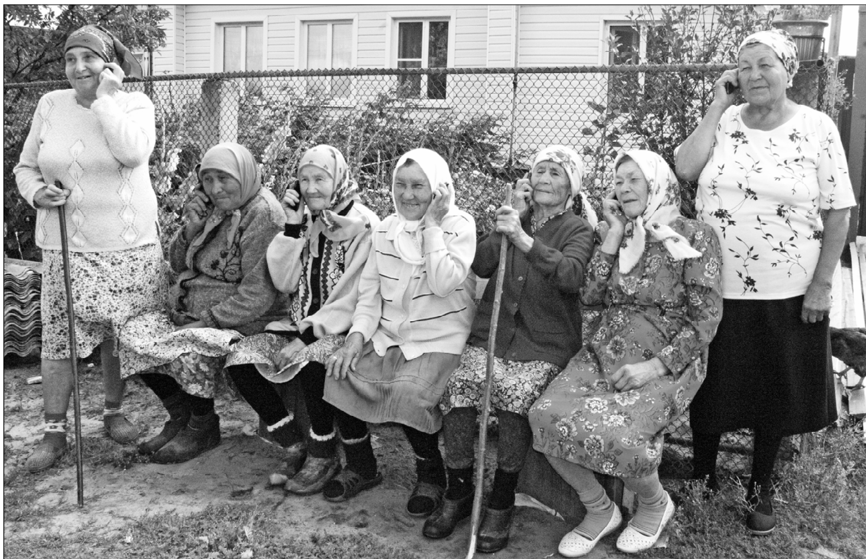
Чӑн та, халӑ ҫӑнӑ технологисем кунран-кун аталанса, вӑй илсе пыраҫҫӑ. 10-15 сӑл каялла чӑнӑрахисем, пунарахисем карас телефонпа ҫӑрнине ӑмсанарах пӑхӑратпӑр тӑк – паян вӑл кашниех пур. Кӑсье телефонне ӑнсӑртран киле манса хӑваратпӑр тӑк – тем ситмен пекх туйӑнат. Лайӑххине ҫын час хӑнӑхӑт сав.

Паян ялта ҫылай килте компьютер пур. Ватти те, вӑтти те Интернетта усӑ кураҫ. Ҫамраксем смартфонпа, планшетпа ҫӑреҫҫӑ. Вӑрнар районӑнчи Вӑрманкара пунакан шурӑпаҫене вара «чӑнӑ кинемейсем» теме пулат.