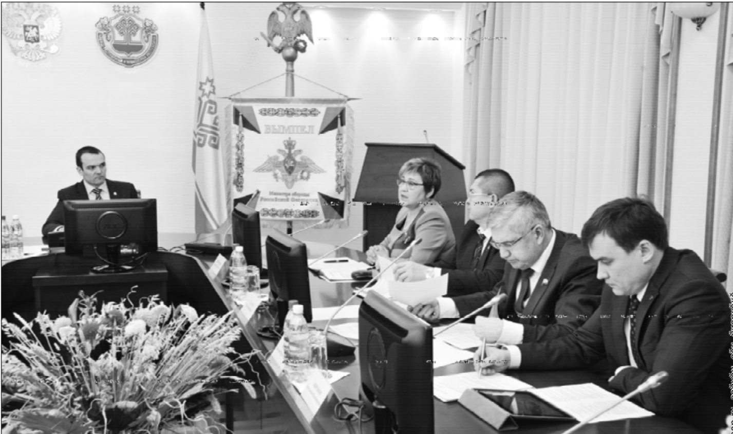
Республика Пуҫлӑхӑ Михаил Игнатьев ӑнер экономикӑна модернизацилӑе тата ӑна сӑнӑ технологисемпе пуянтлас тӑлӑшле ӑҫлекен канаш ларӑвне ирттерчӑ. Унта хутшӑннисене бизнесӑн экологи хутшӑнӑвӑсене явӑлӑхӑ енӑпе Чӑваш Ен пӑлтӑр федерацин 83 регионӑ хушшинче пӑррӑмӑшӑн вырӑнне тухине пӑлтерчӑ.

Вӑсен ӑҫне экологи-энергетика енӑпе хаклакан Интерфакс-ЭРА рейтинг агентствин субъектосе энерги, технология тухӑҫлӑхӑне аталанӑвӑн, предприятисен экологи уҫӑнлӑхӑн шайне тишкернӑ. Республикӑн кашни предприятин производствосе кӑларӑшӑн, вӑсене миҫсе ҫып ӑҫлемӑне, электроэнергетике еплере уҫӑ курнине, ытти ыйтӑва тӑлӑнчӑ. Экономика аталанӑвӑн, промышленноҫ тата ҫу-у-илӑ министрӑн тивӑҫне вӑхӑтлӑхӑ пураҫкан Владимир Аврелькин республика производствосе валли кадросе вӑрентсе хатӑрлӑе тӑлӑшле вӑренӑ заводенийӑсем, патшалӑхӑн тивӑслӑ органсем мӑнлерхе вӑй хуни ҫинчен каласа пачӑ. ЧР Министрствин Кабинетӑн умӑнчи тӑп тӑлӑвӑсенчен пӑрӑ – экономикӑна инновацилӑсем. Ирӑнӑ ӑмӑрте производствара ҫӑр тавар тӑп вырӑн йышӑннӑ пулсан халӑ вӑй суран те ҫителӑксӑртӑн йывӑрлӑха кӑрсе ӑҫкен предприятӑ Чӑваш Енре ҫукпа пӑрех. Тавар туса кӑларакансемӑн ҫехсенче аҫта кадросе пулни, вӑл е ку ӑҫре сӑнӑнне, халӑчен уҫ курман технологисене пӑлни пысӑк пӑлтерӑшлӑ.