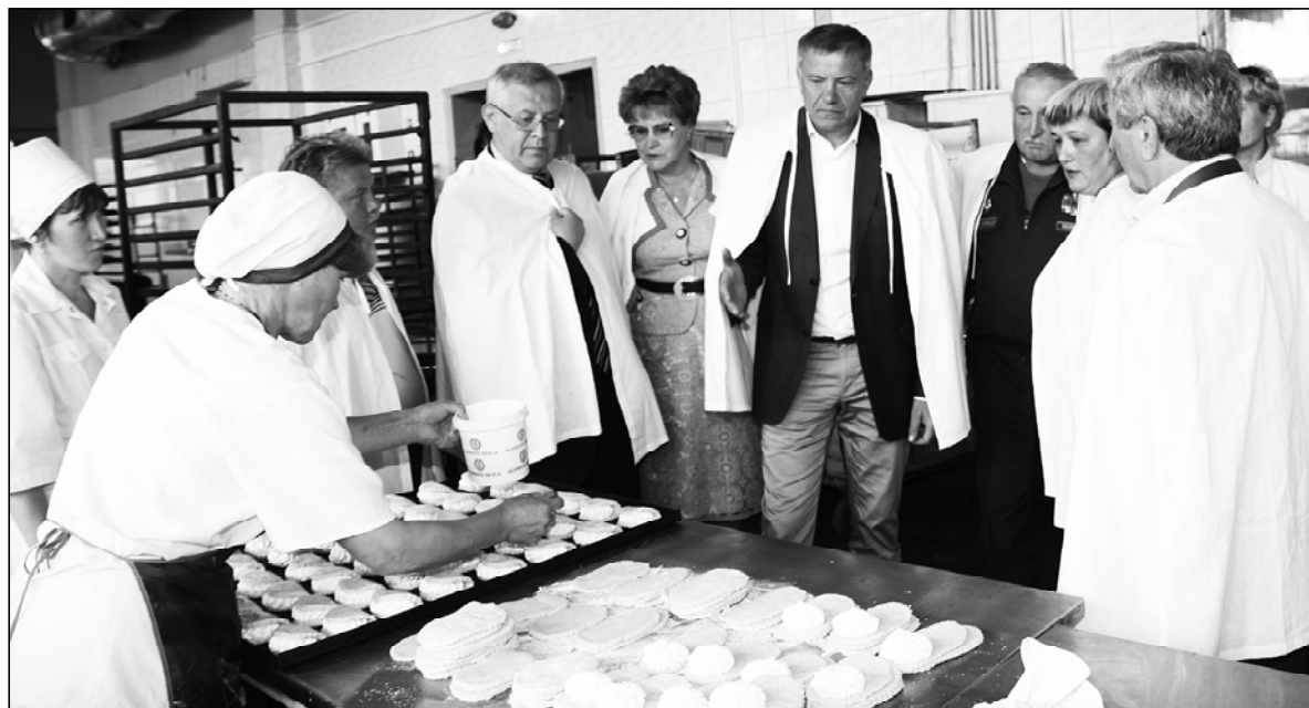
• Крым кооператорәсем Сәрпү райповән сәкәр комбинатчән есәпе паллашасә.