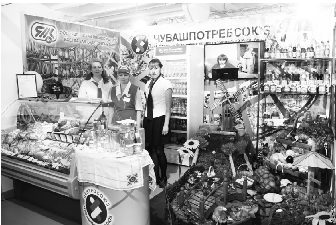
• Чәвашпотребсоюзән Регионсен пәрлөхи «Регионсем – чикәсәр есәтешлөх» куравәнчи экспозиция.