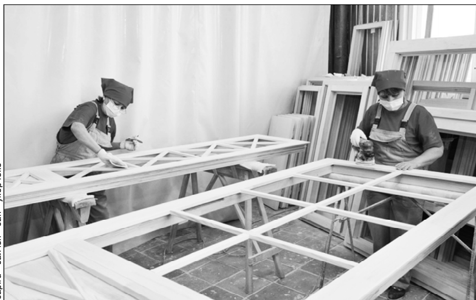
сар.лц сайчөн сән үкерчөкө

Хула сыннисен ыйтавёсене Сывлах сыхлавөн, Строительствө, Экономика аталанăвөн министрствисен ертўсисем хуравланă. Канашлура палартнă тарăх – 2010 сұлтан тытанса Сөнө Шупашкара пулашма федераци тата республика бюджетөсенчен 2,6 млрд тенкө ытла уйарнă. Сак уксапа